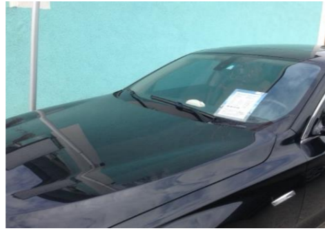
Fahrzeughandel Österreich ca. 100 Fahrzeuge gesichert