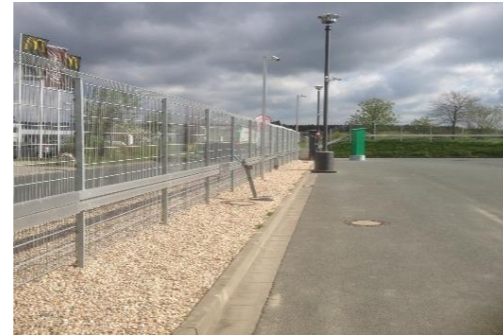
Sicherheitsparkplatz ca. 500 m Perimeterschutz