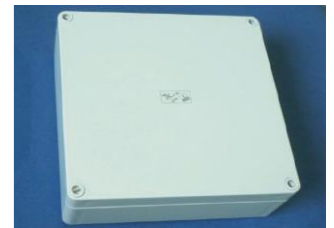
RFID-FLU-Zentraleinheit 182*180*60 mm