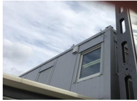
Fahrzeughandel Österreich ca. 100 Fahrzeuge gesichert